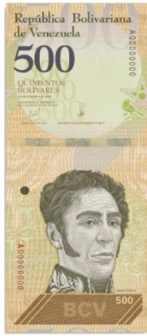
SIMÓN BOLÍVAR [1783 - 1830] Padre de la patria venezolana, nació el 24 de julio de 1783, en Caracas. Reconocido mundialmente como el fundador de la República de Colombia y de Bolivia, es la figura más destacada de la emancipación con visión integracionista del continente latinoamericano.