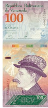
EZEQUIEL ZAMORA [1817 - 1860] Líder y estratega militar venezolano. Nació el 1 de febrero de 1817 en la población de Cúa, estado Miranda. Luchó por la reivindicación de los derechos de los campesinos y los humildes. Es el personaje más destacado de la Guerra Federal (1859-1863).